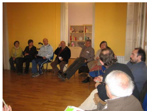
Grup verd i blau