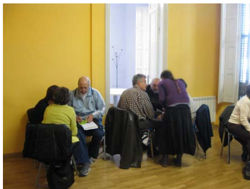
Grups de debat