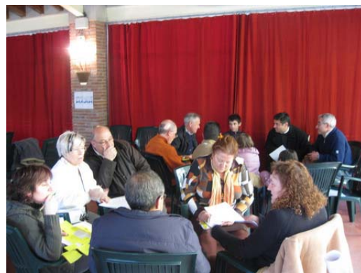
Grup vermell i groc