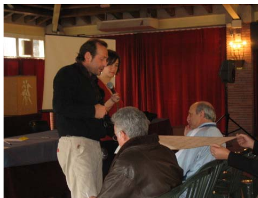
Plenari. Presentació de resultats