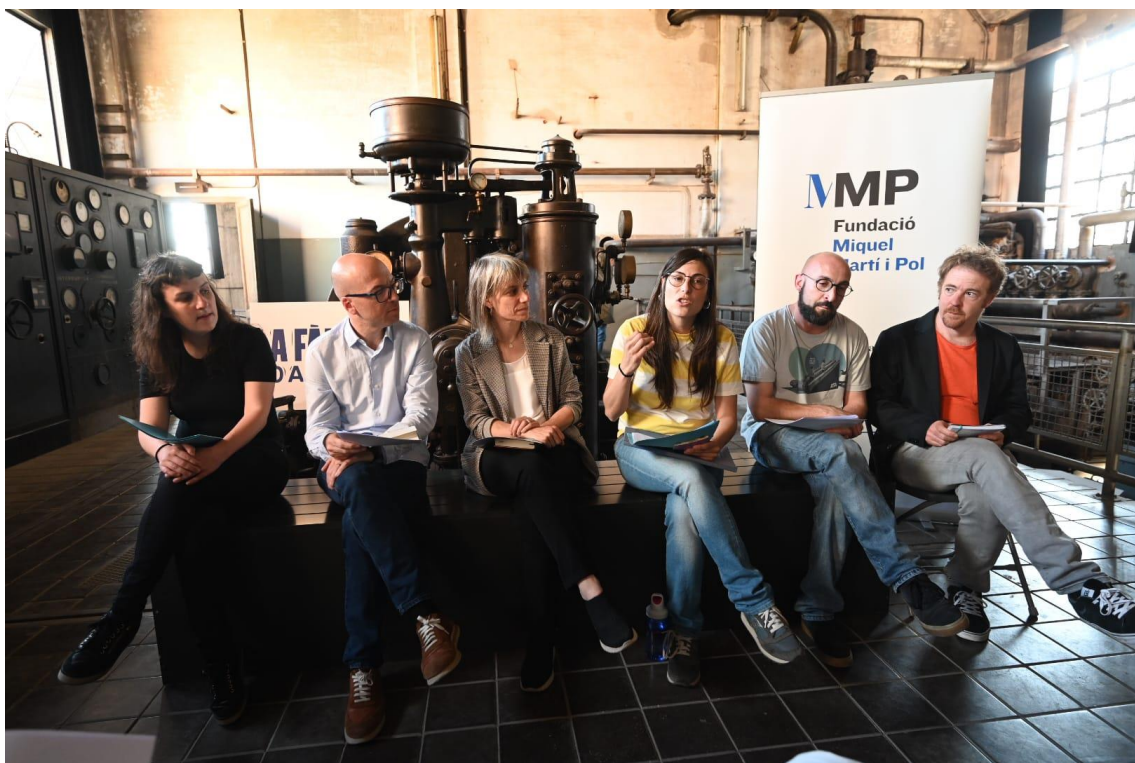
Presentació del projecte «La fàbrica 50 anys» a l'edifici de La Tèrmica de Roca Umbert. Fàbrica de les Arts de Granollers.

S'anima a tothom a organitzar activitats relacionades amb la temàtica per donar a conèixer l'obra des de diverses perspectives. Com? Enviant un missatge electrònic a fundacio@miquelmartiipol.cat o telefonant al 938500355.