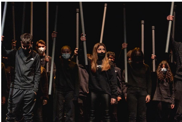
Foto: Representació de La fàbrica en l'estrena de l'espectacle organitzat per la Fundació Miquel Martí i Pol i l'Institut de Roda de Ter.