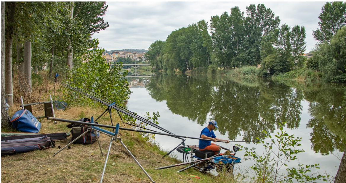
Imatge d'un dels concursos de pesca de la Fira del Pescador de l'edició del 2022.

Durant els tres dies que dura la fira, es preveu que unes 500 persones passin pel recinte firal del Passeig del Ter