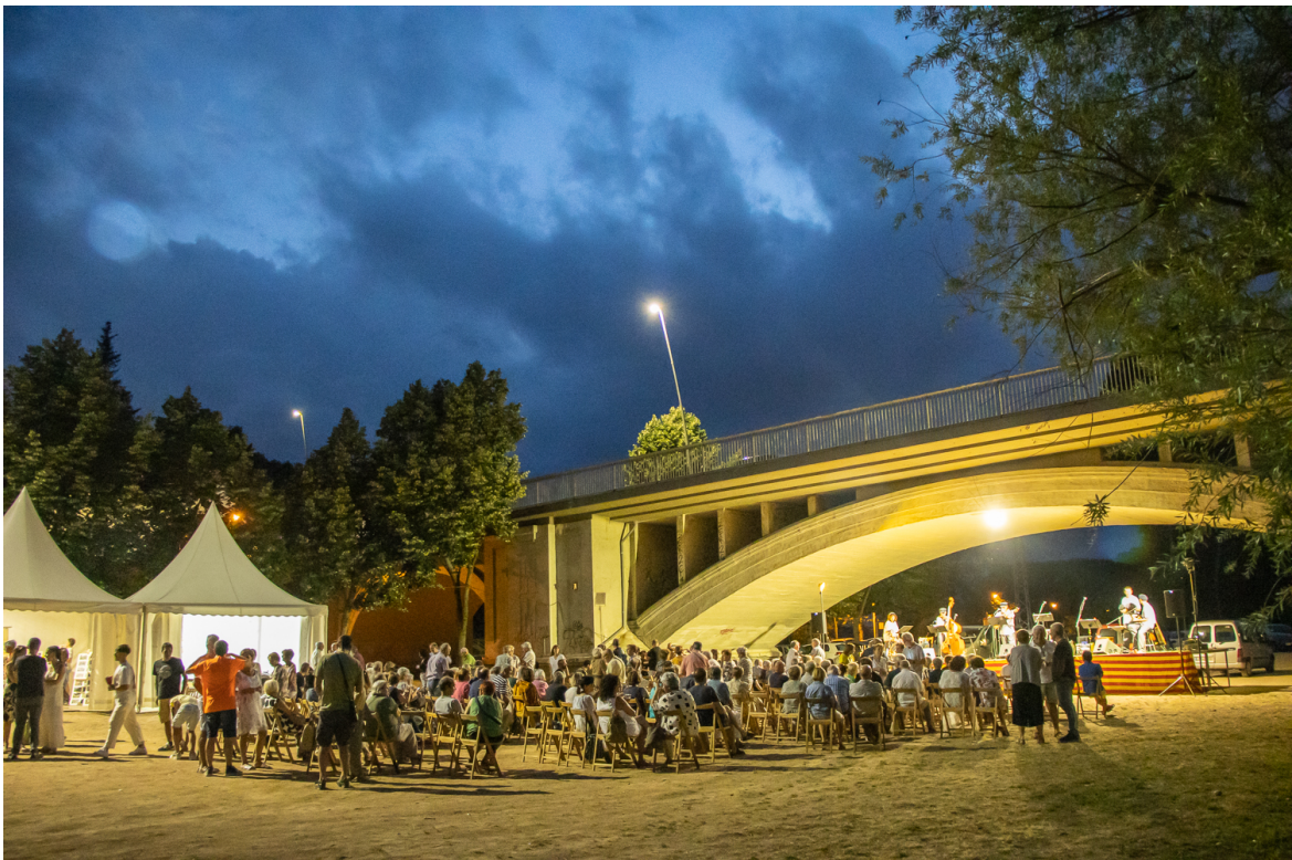
Imatge de la cantada d'havaneres i fi de festa amb rom cremat de la Fira del Pescador de l'edició del 2023.