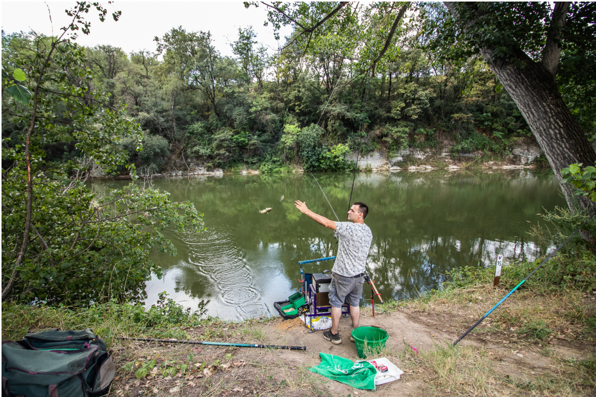
Imatge d'un dels concursos de pesca de la Fira del Pescador de l'edició del 2023.

Durant els tres dies que dura la fira, es preveu que unes 500 persones passin pel recinte firal del Passeig del Ter