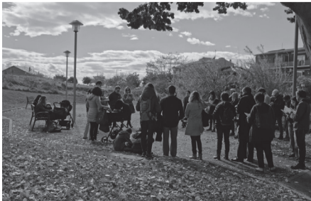
Ruta literària Miquel Martí i Pol.