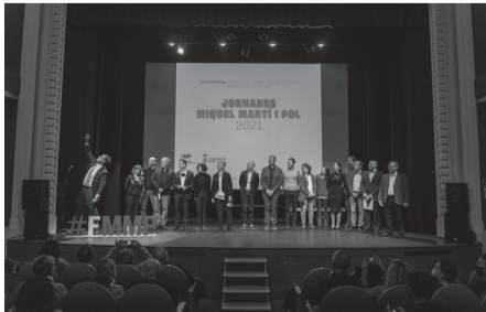
Acte de lliurament dels Premis literaris, artístics i pedagògics.